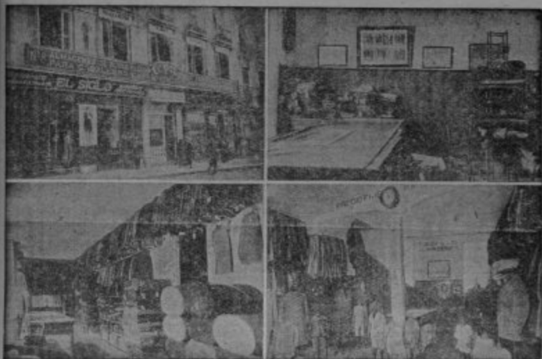
Cuatro vistas parciales de la Casa Matriz en Granada calle de Reyes Católicos

Americanas Sport - Pantalones Tenis - Gabardinas Trajes de confeccion esmeradísima Precios Fijos y económicos, como ninguna otra casa Ventas al contado :-: Siempre nuevos modelos