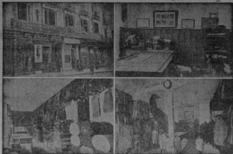
Cuatro vistas parciales de la Casa Matriz en Granada calle de Reyes Católicos

Americanas Sport - Pantalones Tenis - Gabardinas Trajes de confeccion esmeradísima Precios Fijos y económicos, como ninguna otra casa Ventas al contado :-: Siempre nuevos modelos