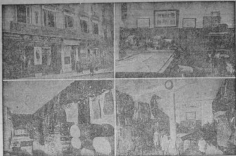
Cuatro vistas parciales de la Casa Matriz en Granada calle de Reyes Católicos

Americanas Sport - Pantalones Tennis - Gabardinas Trajes de confeccion esmeradísima Precios Fijos y económicos, como ninguna otra casa Ventas al contado :: Siempre nuevos modelos