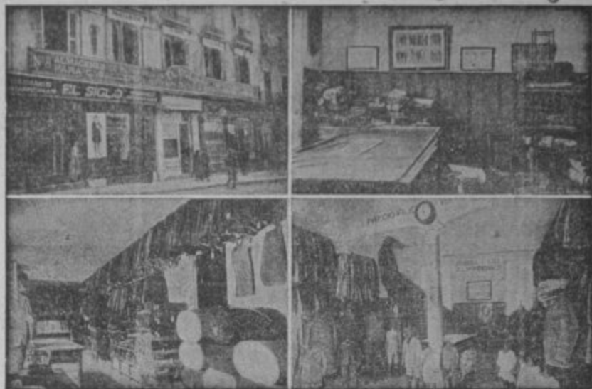
Cuatro vistas parciales de la Casa Matriz en Granada calle de Reyes Católicos

Americanas Sport - Pantalones Tenis - Gabardinas Trajes de confeccion esmeradísima Precios Fijos y económicos, como ninguna otra casa Ventas al contado :-: Siempre nuevos modelos