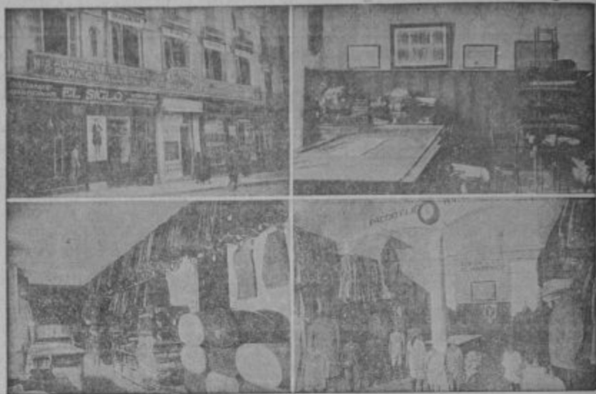
Cuatro vistas parciales de la Casa Matriz en Granada calle de Reyes Católicos

Americanas Sport - Pantalones Tenis - Gabardinas Trajes de confeccion esmeradísima Precios Fijos y económicos, como ninguna otra casa Ventas al contado :-: Siempre nuevos modelos