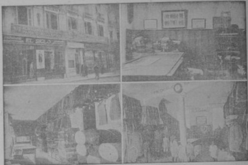
Cuatro vistas parciales de la Casa Matriz en Granada calle de Reyes Católicos

Americanas Sport - Pantalones Tenis - Gabardinas Trajes de confeccion esmeradísima Precios Fijos y económicos, como ninguna otra casa Ventas al contado :-: Siempre nuevos modelos