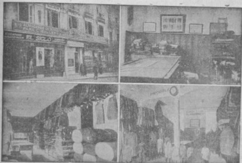
Cuatro vistas parciales de la Casa Matriz en Granada calle de Reyes Católicos

Americanas Sport - Pantalones Tenis - Gabardinas Trajes de confeccion esmeradísima Precios Fijos y económicos, como ninguna otra casa Ventas al contado :-: Siempre nuevos modelos