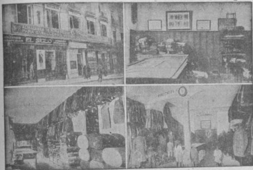
Cuatro vistas parciales de la Casa Matriz en Granada calle de Reyes Católicos

Americanas Sport - Pantalones Tennis - Gabardinas Trajes de confeccion esmeradísima Precios Fijos y económicos, como ninguna otra casa Ventas al contado :: Siempre nuevos modelos