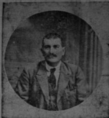
DON FRANCISCO LÓPEZ Y LÓPEZ