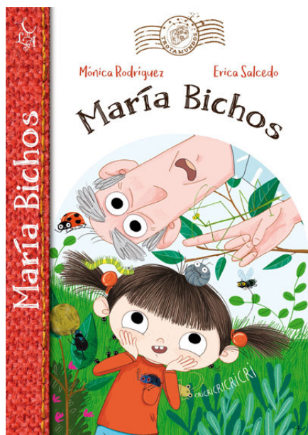
María Bichos / Mónica Rodríguez. Ilustraciones de Erica Salcedo. Almería: Libre Albedrío, 2018. 78 p.

La infancia es terreno óptimo para trabar amistades curiosas e imposibles. Quien más y quien menos ha tenido algún compañero en sus bolsillos, escondido a los ojos de los mayores, o encerrado en un tarro de cristal. María Bichos nos cuenta, en esta simpática aventura, como es su día a día con estos divertidos bichitos: la araña Anita, Mariapalo, la mosca, el escarabajo Ra, las trece hormigas que viven en una caja de cerillas... Pero sobre todo quiere compartir las mejores horas que disfruta cada jornada, que son aquellas que vive junto a su incansable abuelo y todo este plantel de invitados estelares.