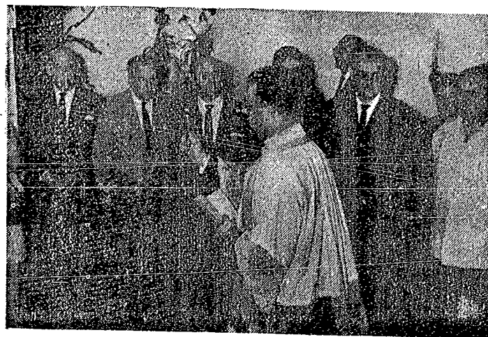
Un momento de la bendición del acto.