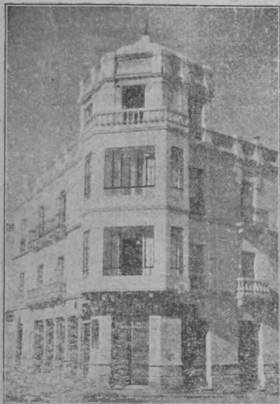
Sucursal en BAENA, P. de la Constitución, 19.